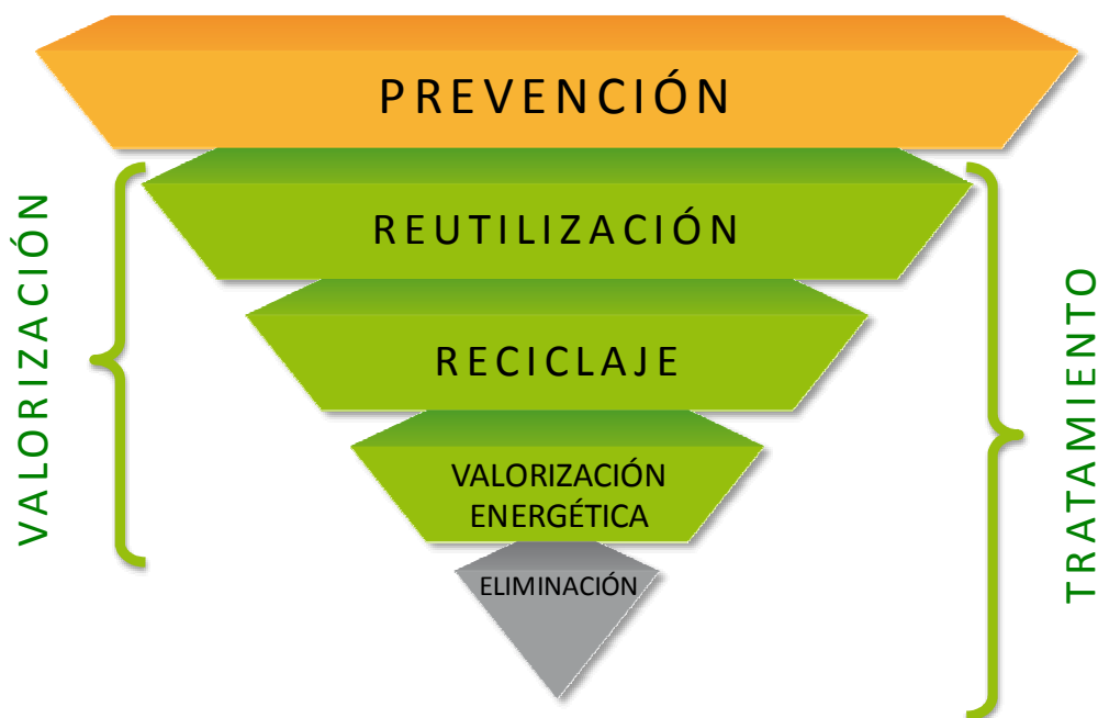
Gráfico 3 Pirámide jerarquía en la gestión de residuos 6